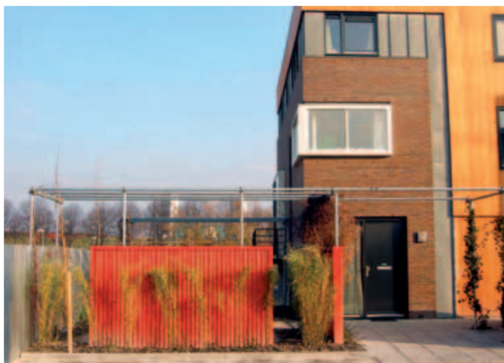
Afscherming van de tuin bij een woning in Capelle aan den IJssel met rode golfplaten.

Waar de gevel enkele decimeters naar binnen springt heeft Duotuin een verhoogd terras aangebracht op het niveau van de woonkamer, ongeveer anderhalve meter boven het niveau van de tuin. Achterin de tuin ligt een enigszins verhoogde houten vlonder als echo van dit terras. Een muur van verweerde bakstenen, gestapeld in een raster van bouwgaas schermde deze vlonder af van het laatste tuingedeelte, dat bestaat uit een grondvlak van boomschors waarin berkenbomen staan.