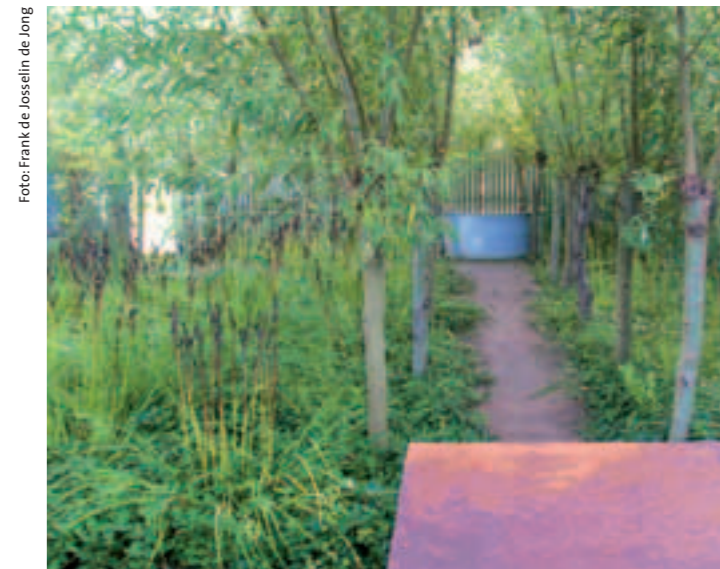
De Poldertuin in Tuinarchitectuurpark Makebljide te Houten. Een voetpad van rijplaten eindigt bij de douche in een veedrinkbak. Foto links: Een zwevende rijplaat plooit zich tot een eettafel.

Mijn grootouders woonden in een middelgrote stad in een rijtjeshuis uit de jaren dertig. De bescheiden achtertuin was verkleind door de aanbouw van een glazen serre, waar mijn oma schilderde. De tuin bestond uit een klein gazon met begroeiing tegen de scheidsmuren naar de beide aangrenzende woningen. Achterin de tuin stond een houten schuurtje, althans, ik vermoed dat het schuurtje achterin de tuin stond, want een struikengroep naast het schuurtje onttrok de achtergrens aan het zicht. Daar begon voor mij als kind de wildernis. Als levend bewijs van deze wildernis kroop over het gazonnetje een landschildpad. Enorme hoeveelheden groente en fruit zette hij om in een nauwelijks waarneembare groei. Ik heb me laten vertellen dat waterschildpadden in een kleine vijver kleiner blijven dan hun soortgenoten in een groot water. Zou een landschildpad op een klein gazon op dezelfde wijze klein blijven? De huidige tuinrichting laat geen ruimte voor wildernis. De tuin wordt geheel bestraat en tot onderdeel van de woning gemaakt. De tuin mag geen onderhoud vergen, want daar hebben we te weinig vrije tijd voor beschikbaar. Er is de laatste decennia zodoende een stenen tijdperk ingetreden in de tuinaanleg. De tuin is nu een buitenkamer. Tuinfauteuils zijn op de markt te krij-