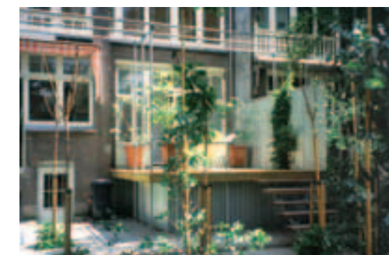
Terras bij een oude woning.

zijn afgeleid van het woonhuis. Dit levert een afgewogen compositie van terrassen, plantvakken en verharding, waaraan tuinmuren, pergola's en de omheining de derde dimensie toevoegen. De tuin krijgt vaak een volledige omheining die de omgeving buitensluit. Daardoor ontstaat een microkosmos in de eigen tuin, die het effect heeft van een kijkdoos.