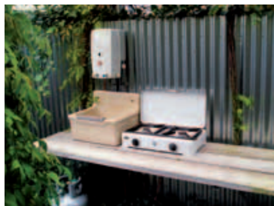
Details van de Poldertuin in Makeblide: het keukenblok en de zwevend bevestigde rijplaten.