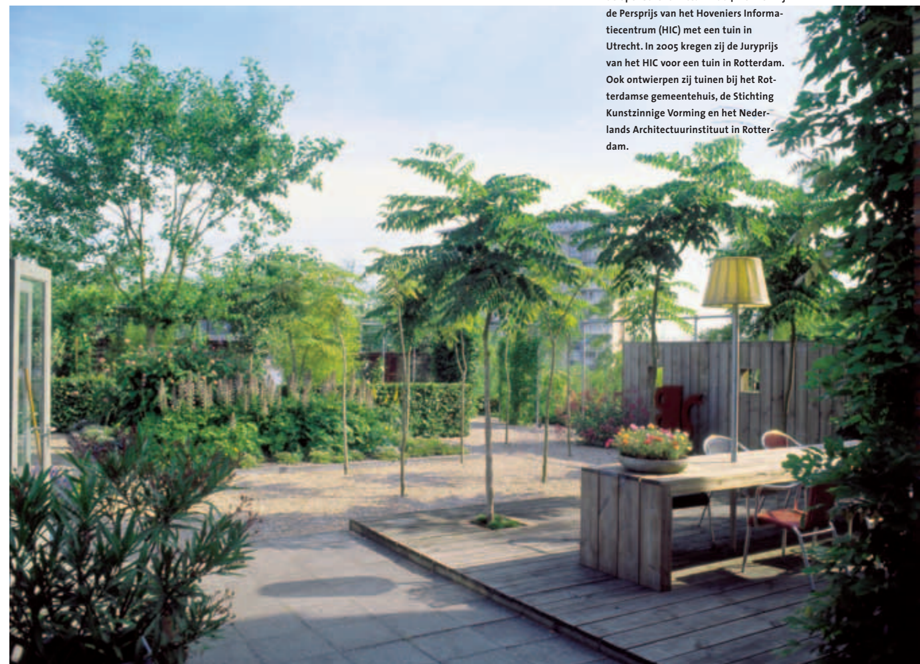
De tuin in Rotterdam die werd uitgeroepen tot Tuin van het Jaar 2005, juryprijs van het Hoveniers Informatiecentrum.