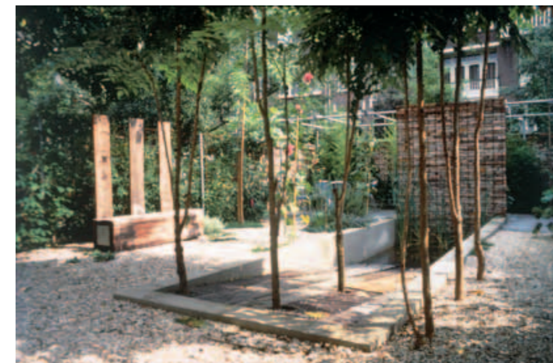
Tuin met scheepshelling van oud havenhout.

De inspiratie voor de beeldvorming van hun tuinen ontleent Duotuin onder meer aan verwaarloosde industrie- en haventerreinen, waar de natuur de menselijke bouwsels overwoekert. Bomen hangen scheef over een muur rond een verlaten werkterrein, bramen overgroeien lege