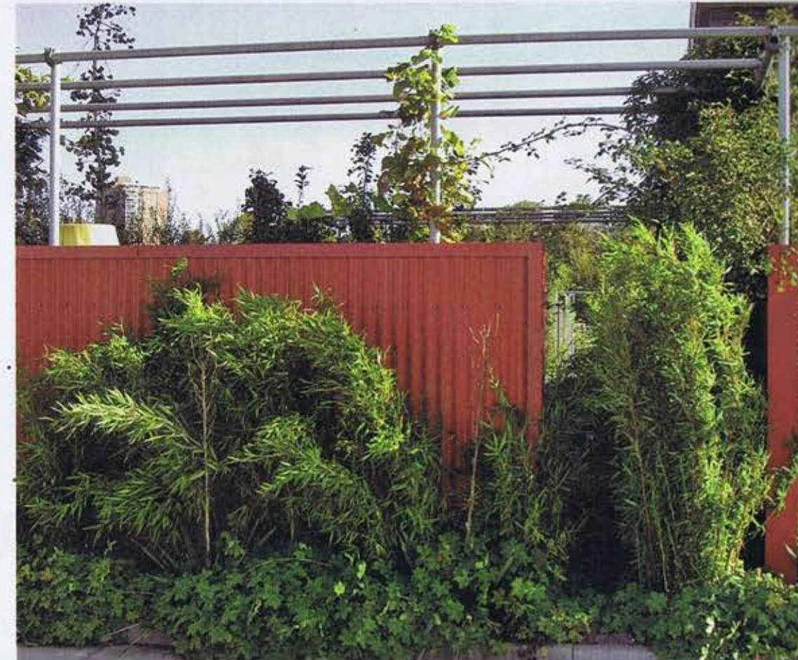
Bamboe gaat de hoogte in en geranium bedekt de bodem.

grondslag aan het plaatsen van deze wand. „De wand staat circa 1 meter van de grenslijn af. Hierdoor krijg je van de straatzijde een mooi beeld omdat er wintergroene planten voor zijn gezet. Groei- en bladvorm speelden een belangrijke rol bij de plantenkeuze. De bamboe, een niet-woekerende Fargesia , gaat de hoogte in en Geranium macrorrhizum bedekt de bodem en geeft kleur in het voorjaar. Tussen deze twee planten snijdt het 'scherpe' yuccabladd. Het een versterkt het ander“, verklaart Tom zijn keuzes. De wand is niet geheel doorgetrokken; smalle doorkijkjes moeten claustrofobiegevoelens voorkomen en het totaalbeeld krachtiger maken. De schutting is dubbelwandig en oogt als een losstaand object. Voor de bovenzijde werd een U-profiel gemaakt dat garant staat voor een strakke afwerking. Door de U-profielen steken hier en daar steigerbuizen die samen een pergola vormen. De afwerking is tot in perfectie uitgevoerd, wat blijkt uit de geplastificeerde bouten in de kleur van de wand. In contrast met deze strakke elementen is in de zijtuin een lijn gevormd van dertien Ginkgo biloba . Na een aantal jaren moet de grillige habitus van deze bomen het strakke van wand en pergola verzachten.