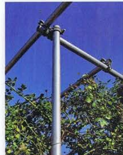
Steigerbuizen in een hoofdrol.