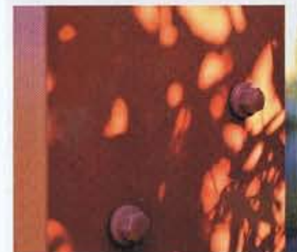
Afwerking tot in perfectie.

grondslag aan het plaatsen van deze wand. „De wand staat circa 1 meter van de grenslijn af. Hierdoor krijg je van de straatzijde een mooi beeld omdat er wintergroene planten voor zijn gezet. Groei- en bladvorm speelden een belangrijke rol bij de plantenkeuze. De bamboe, een niet-woekerende Fargesia , gaat de hoogte in en Geranium macrorrhizum bedekt de bodem en geeft kleur in het voorjaar. Tussen deze twee planten snijdt het 'scherpe' yuccabladd. Het een versterkt het ander“, verklaart Tom zijn keuzes. De wand is niet geheel doorgetrokken; smalle doorkijkjes moeten claustrofobiegevoelens voorkomen en het totaalbeeld krachtiger maken. De schutting is dubbelwandig en oogt als een losstaand object. Voor de bovenzijde werd een U-profiel gemaakt dat garant staat voor een strakke afwerking. Door de U-profielen steken hier en daar steigerbuizen die samen een pergola vormen. De afwerking is tot in perfectie uitgevoerd, wat blijkt uit de geplastificeerde bouten in de kleur van de wand. In contrast met deze strakke elementen is in de zijtuin een lijn gevormd van dertien Ginkgo biloba . Na een aantal jaren moet de grillige habitus van deze bomen het strakke van wand en pergola verzachten.