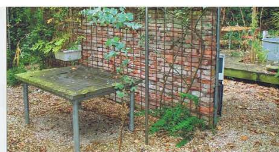
Deze strandtafel is een ontwerp van Eric Odinet.

De beplanting in de tuinen van Duotuin is zeker niet overvloedig, draagt bij aan het kunstwerk tuin en kan tegelijk heel functioneel zijn. In de winnende Utrechtse tuin bijvoorbeeld onttrekken een blauwe regen en een christusdoorn het bad aan het oog van de burens, zodat de bewoner heerlijk kan genieten in zijn jacuzzi. In een van de andere tuinen vormen twee rijen wilgenstammetjes de ondersteuning voor een naar beneden lopend pad van rijplaten. In het begin ogen veel van hun tuinen kaal. „Wij zijn goed in langetermijnplanning. Het behoud van de strakke lijnen. In het begin hebben dode materialen de overhand. Die ogen dan heel overweldigend. Langzaam, maar zeker groeit het groen tot het met elkaar in balans is,” omschrijft Tom.