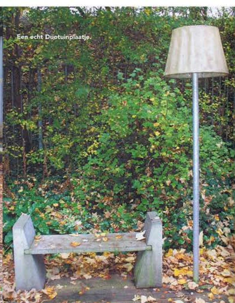
Een echt Duotuinplaatje.