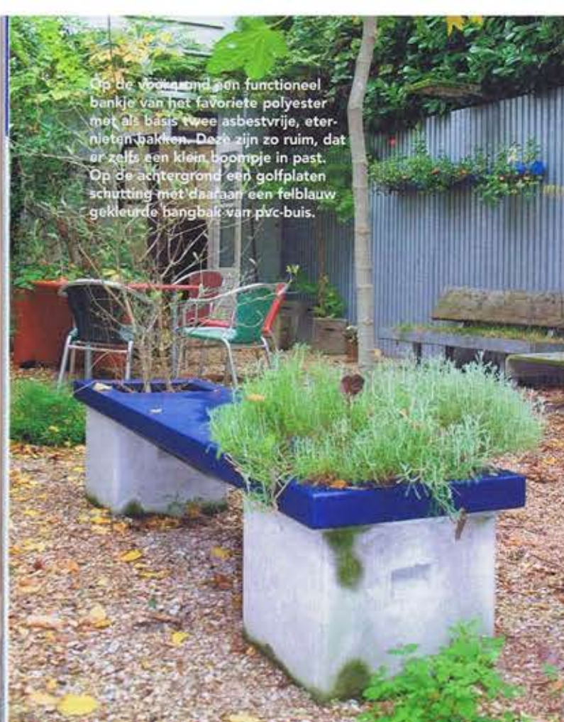
Op de voorgrond een functioneel bankje van het favoriete polyëster met als basis twee asbestvrije, eternietenbakken. Deze zijn zo ruim, dat er zelfs een klein boompje in past. Op de achtergrond een golfplaten schutting met daaraan een felblauw gekleurde hangbak van pvc-buis.