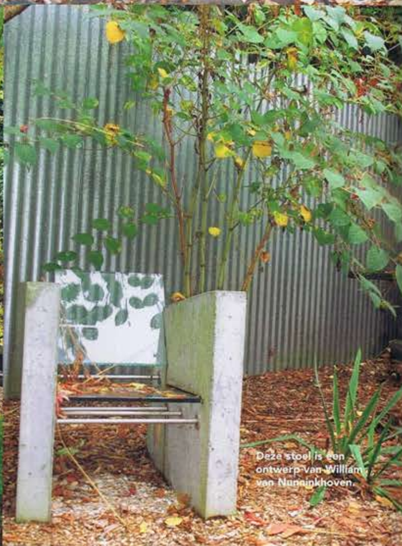
Deze stoel is een ontwerp van William van Nunaikhoven.

aan een hele felgekleurde wand en vrolijk gekleurde meubelen en plantenbakken.